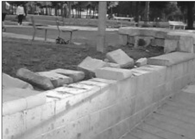
I mattoni divelti dal muretto realizzato da pochi mesi