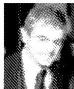
IL SINDACO Sergio Chiamparino

GROSSETO. Numerose modifiche temporanee alla circolazione stradale in occasione degli eventi in programma a Grosseto.