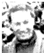
L'ASTRONAUTA Maurizio Cheli