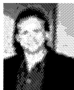
L'ATTORE Giulio Scarpati